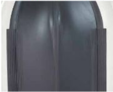
3 zusätzliche Scheuerleisten